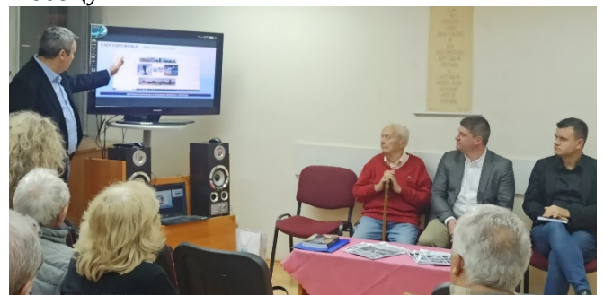
Окупљање чланова у новембру 2022 Посета председника општине

Рад Удружења је значајно успорила и утицала на пад активности пандемија корона вируса. Удружење је са активним окупљањима после пандемије започела у мају 2022. године на уобичајеној старој адреси у улици Деспота Стефана 12, на 8. спрату, традиционално последњег уторка у месецу.