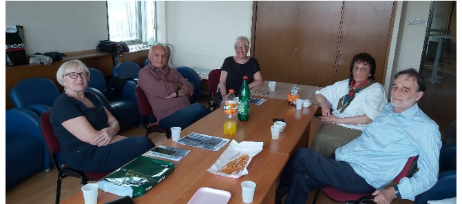
Мајско окупљање Удружења

Мајско окупљање је одржано 30.3.2023. од 18.00. На овом окупљању је представљен нови број 46. нашег гласила Параћинац.