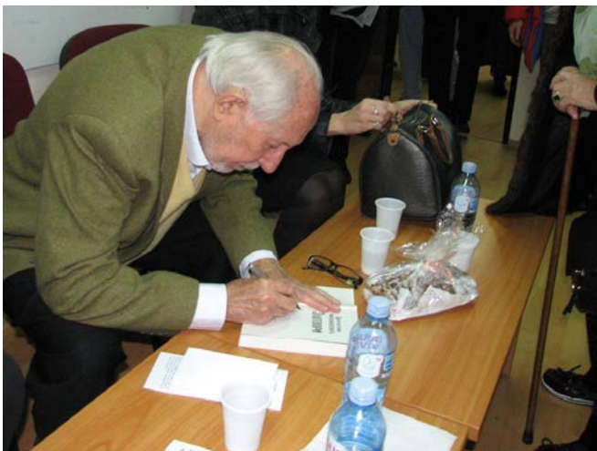
Промоција књиге "Злотвори" октобар 2017. године

Академик Драгослав Михаиловић је био и почасни председник нашег Удружења Параћинаца. Радо се одазивао на наша окупљања и имали смо прилике да организујемо изузетне догађаје као што су промоције његових књига. Последња таква промоција књиге "Злотвори" била је на октобарском окупљању 2017. године.