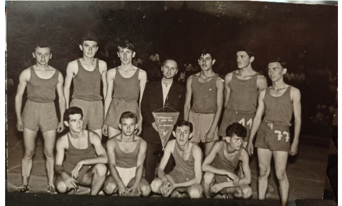
КК Борац, основан 1953.

Каснији догађаји су утицали да су средњошколци из Ђуприје и Параћина отишли на студије, па је даљи развој, колико ми је познато, настављен са женском екипом која је имала успех, а тренирао их је један од бивших играча КК БОРАЦ Аца.