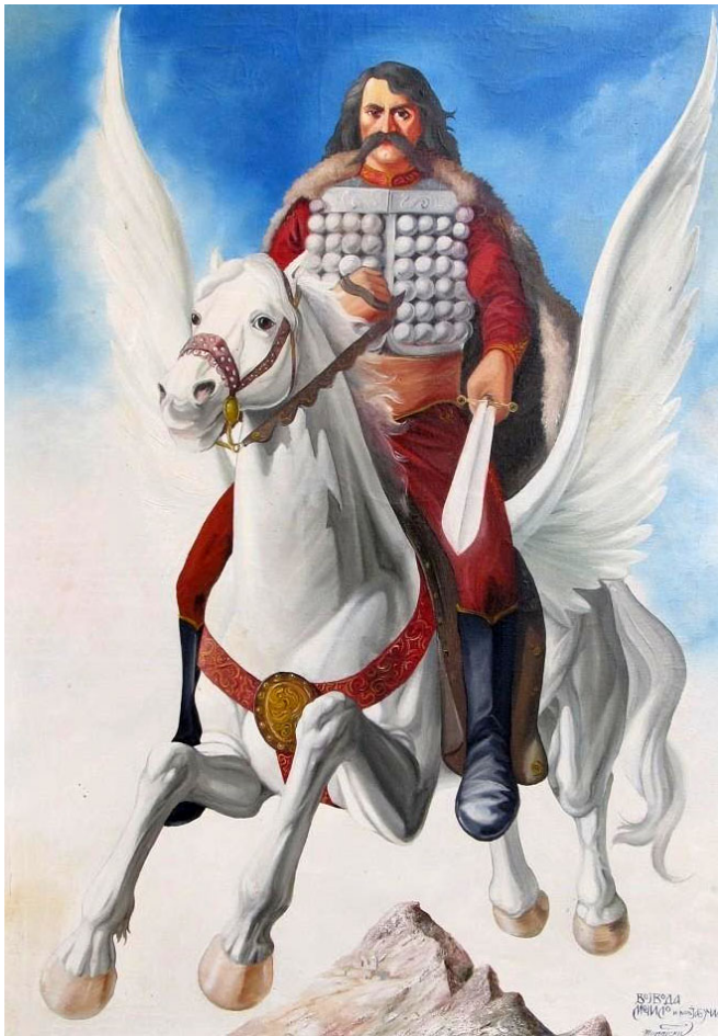
Војвода Момчило и коњ Јабучило

Војвода Момчило , носио је титуле војводе, деспота и севастократора. По њему једно утврђење, западно од Поточца, општина Параћин, и данас носи назив - град Војводе Момчила или само Момчилов град. Момчило је био први србски војвода који је победио Турке, а које су Грци, као своје савезнике против Срба, довели на Балкан.