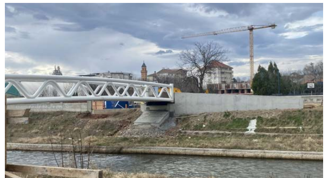
Пешачки мост код базена "Престиж"