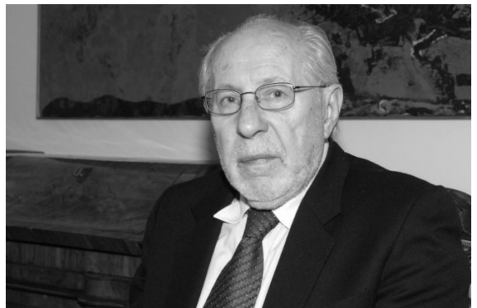
Академик Драгослав Михаиловић

Овом приликом је чланство обавештено да је преминуо академик Драгослав Михаиловић – писац, сценариста, драматург. Академик Драгослав Михаиловић преминуо је у Београду у 93. години, а књижевношћу се бавио готово до последњег дана. Чувени писац, романсијер, сценариста, драматург Драгослав Михаиловић је био редовни члан Српске академије наука и уметности. Добитник је многих књижевних награда и признања. Његов књижевни опус обухвата приповетке, романе и драме. Изабрана дела су му штампана два пута, у шест књига 1984. и у седам књига 1990. године. Његова дела су превођена на више европских језика.