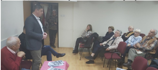
Окупљање чланова у новембру 2022 и обраћање Председника Општине Параћин

Рад Удружења након пандемије је обновљен у погледу окупљања чланства у мају 2022 године. Састанак је одржан 31. маја од 18:00 на уобичајеној старој адреси у улици Деспота Стефана 12, на 8. спрату.