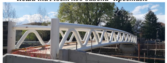
Пешачки мост код Споменика Бранку Крсмановићу