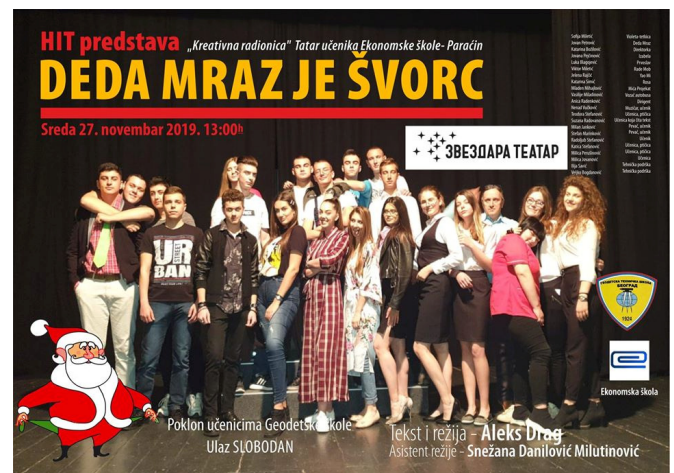
Плакат за представу "Деда Мраз је шворц"