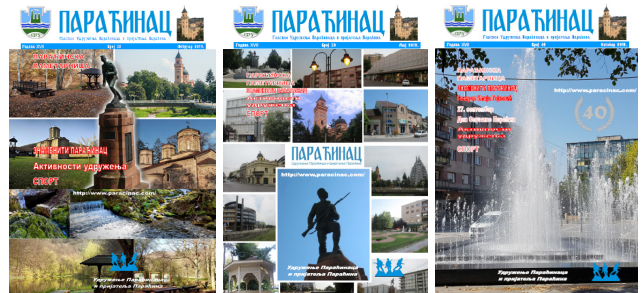
Насловне стране гласила Параћинац у 2019. години

У овој години су изашла три броја нашег гласила Параћинац и то у фебруару (бр.38), у мају (бр.39) и у октобру јубиларни 40. Број. У плану је припрема Зборника свих бројева нашег Гласила Параћинац на CD рому у пдф формату, који ће бити доступан и на нашем сајту за преузимање.