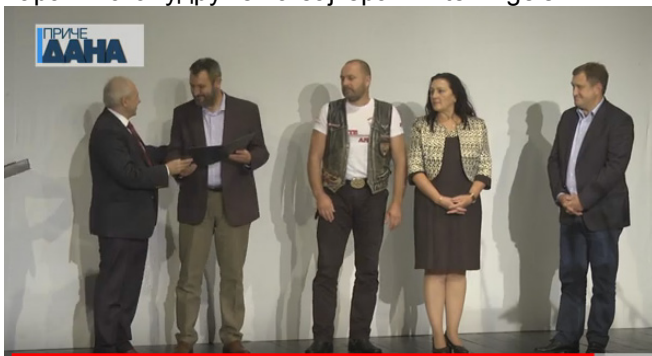
Уручење Златне плакете Удружењу за допринос промоцији града Параћина

Ове године у Параћину је одржан и 13. мото скуп у некадашњој касарни 7. јули. На овом скупу је био присутан велики број бајкера из свих крајева Србије које су између осталих у два дана забављали Инспектор Блажа, BandX (Tribute AC/DC) и Атомско склониште. Тринаести мото скуп у Параћину је истовре-мено била и прослава 25. година рада параћинског удружења бајкера White Angels.