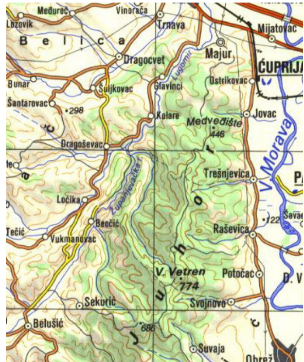
Јухор на топографској карти

На Јухору је било хајдучких чета и одметника од турског зулума, што се памти и преко три данашња хидронима-Ајдучки кладенац, Ан код Ајдучког кладенца Ајдучки поток. И народно предање говори о постојање хајдука на Јухору. Тако у једној шаљивој песми коју је забележио Милан Ђ. Милићевић, у делу „Кнежевина Србија“ стоји и овај стих: „Поточани сви редом хајдуци“. А село Поточац се и данас налази испод Јухор-планине, некада је било још дубље засељено у јухорској бучини.