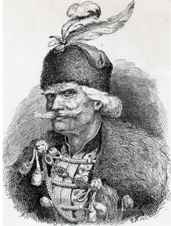
Старина Новак (рођен јоко 1520. г) (Урош Предић, цртао по народној песми)