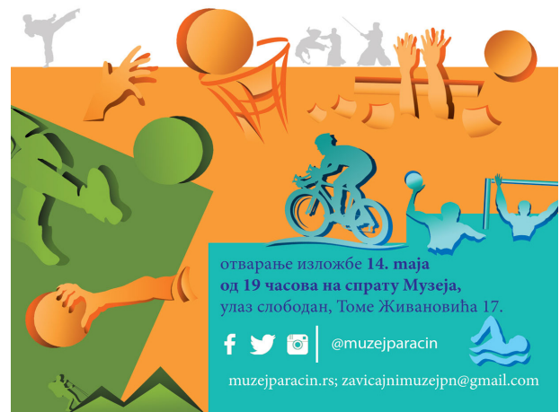
Пано изложбе Спортски дух Параћина

Редовно априлско дружење је одржано у уторак 23.4.2019. од 18.00 и тада је поновљена презентација публикације ПРИВРЕДА ПАРАЋИНА – од млина до савремене индустрије, као и изложба Спортски дух Параћина која је постављена на прошлом, мартовском окупљању. На априлском окупљању је планирана и одржана и Годишња скупштина Удружења Параћинаца, са предлогом за избор руководећих органа Удружења у складу са Статутом Удружења.