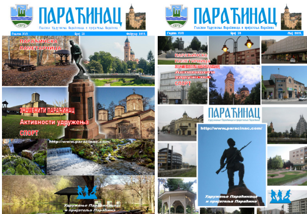
Насловне стране гласила Параћинац у 2019. години

У овој години су изашла два броја нашег гласила Параћинац и то у фебруару (бр.38) и у мају (бр.39). Пред Вама је јубиларни 40. број гласила Параћинац, који због обима информација излази на повећаном броју страна.