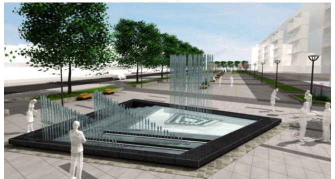
Изглед пројекта фонтане у Параћину

Фонтана је у црном граниту, трапезног облика, прати контуре парцеле, има димензије 12x11 метара и светлосне ефекте у бојама српске заставе, а млазеви за воду ће радити у три различита режима у зависности од временских прилика. Око фонтане се налазе осам нових лепо дизајнираних клупа.