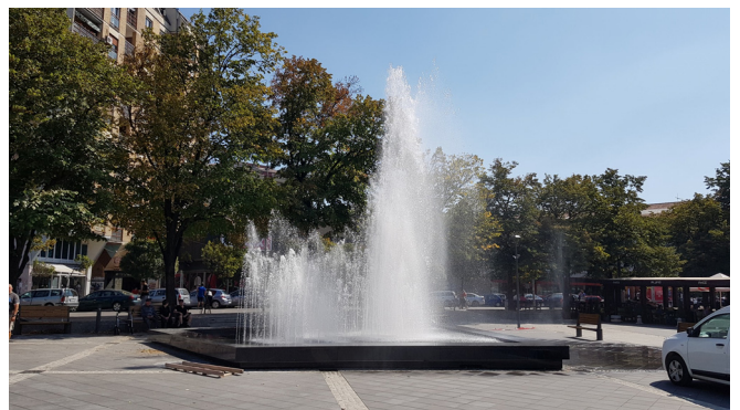
Фонтана у Параћину

Изградња и уређење новог трга поред градске ламеле једна је од кључних инвестиција које су реализоване у овој години. На трг је враћена стара калдрма, а цео пројекат обухвата уређење пешачке зоне од зграде новог Културног центра до главне улице. Трг је добио коначан изглед, са уређеним зеленим површинама и дрвећем, док је поред чесме и парковског инвентара, постављен и видео надзор. Некадашњи паркинг, сада има лепшу намену за грађане и организацију манифестација, а паралелно се ради на новом паркинг простору, односно изградњи гараже.