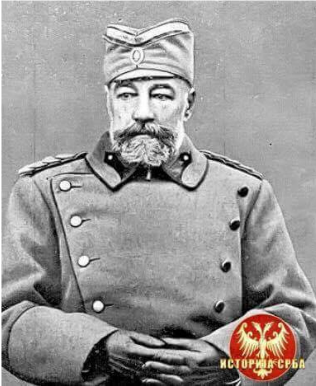
Генерал Илија Гојковић

Генерал Илија Гојковић, рођен у Дреновцу, 1854. године, је био српски генерал и министар војни у влади Краљевине Србије.