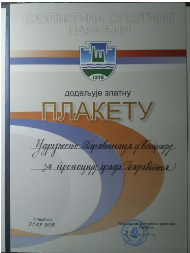
Златна лакета Удружењу Параћинаца за промоцију града Параћина

Ова плакета је значајна за наше Удружење као признање за досадашњи 19-о годишњи рад и подстрек да се настави још боље у промоцији нашег града и даљој промоцији нашег Удружења у Београду и Параћину.