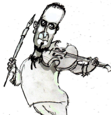
Аутор карикашуре: Миро Георгиевски (Скопље, Македонија)