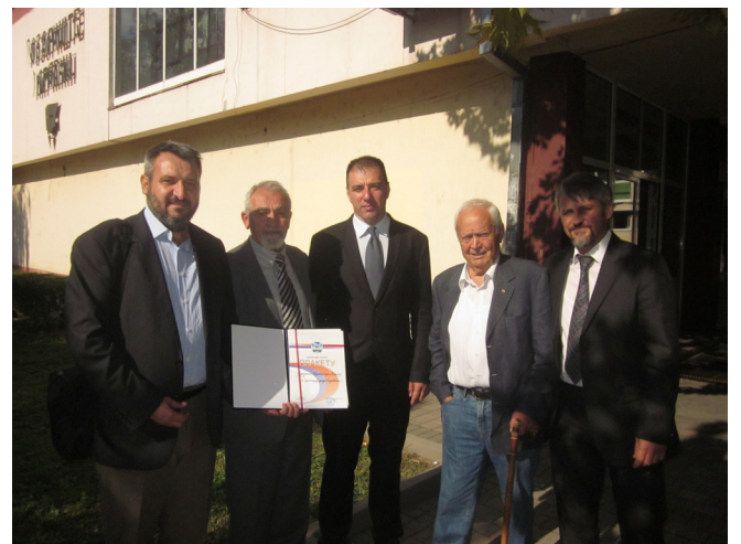
Делегација Удружења Параћинаца са председником општине