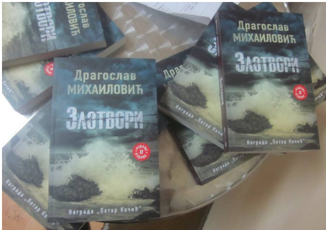
Злотвори Драгослава Михаиловића

Овде ће бити речи о роману Злотвори Драгослава Михаиловића , заправо о муштеријама смрти , како писац назива жртве најмрачнијег периода комунистичке револуције код нас, спровођене од стране специјалиста смрти , тј. целата са Голог отока, у режији другова из Политбироа и креатора Великог Мештра из Румунске улице на Дедињу.