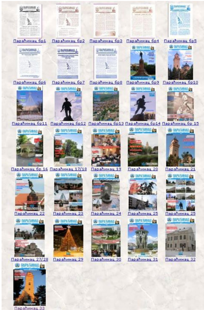
Сви бројеви Параћинаца у pdf формату на нашем сајту

Активности у којима је Удружење имало учешћа у претходном периоду су организација две запажене књижевне вечери и подршка једној изложби.