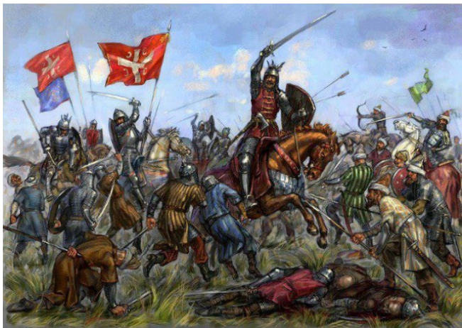
Бој на Косову