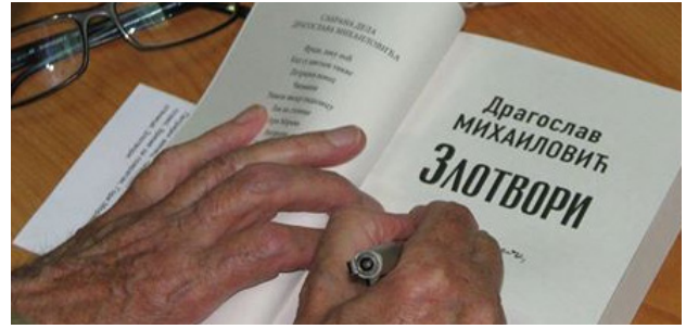
Злотвори – Добитник награде Петар Кочић за 2017. годину

На промоцији књиге Злотвори су били и представници локалне самоуправе из одељења за урбанизам Општине Параћин, који су задужени и за сарадњу са нашим Удружењем.