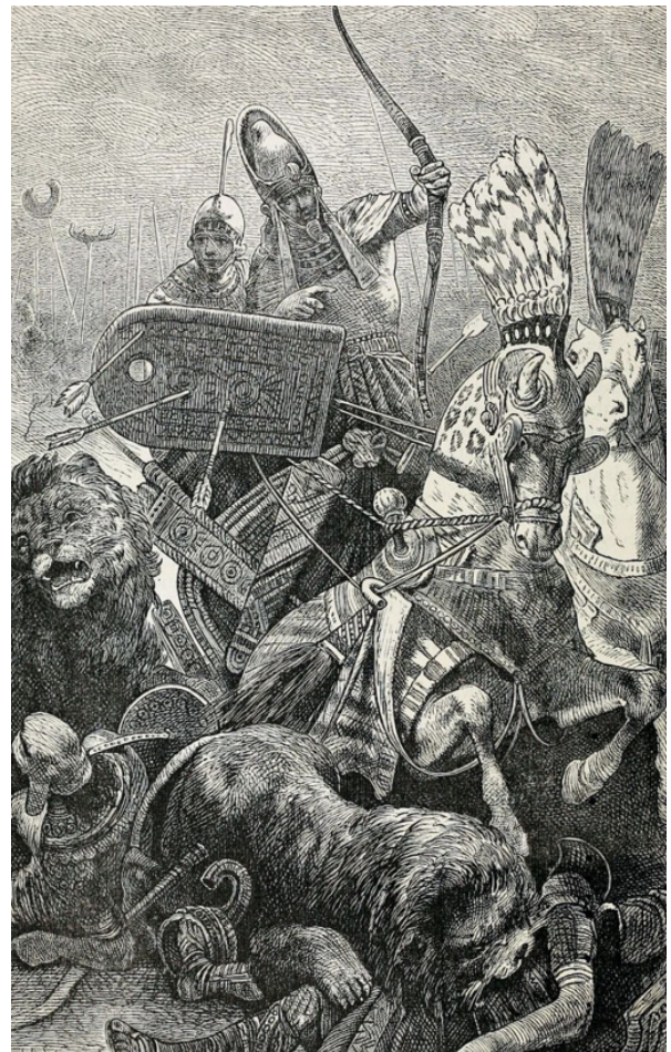
Рамзес II у бици код Кадеша

У Мисиру, у Египту, гарда фараона Рамзеса Другог била је састављена од Срба и она му је омогућила победу у бици код Кадеша, против Хетита. Ту битку је опевао песник мисирски, Пантаур. Он за њих каже Сарбаниси - срца борбенога . Али име Срб налази се и у многим топонимима, именима градова, река језера. Херодот говори о Србовском језеру . То је залив на Средоземљу где пустињски ветар набаца песак који се задржи на површини воде, па се тешко прави разлика између чврстог тла и језера. Према Херодоту ту је у јуришу налетео неки одред србске коњице и утопио се, па је језеро по Србима добило тај назив.