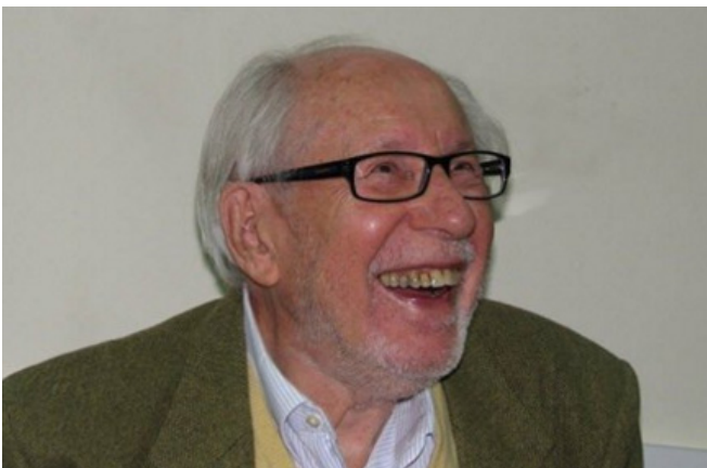
Академик Драгослав Михаиловић на промоцији књиге Злотвори