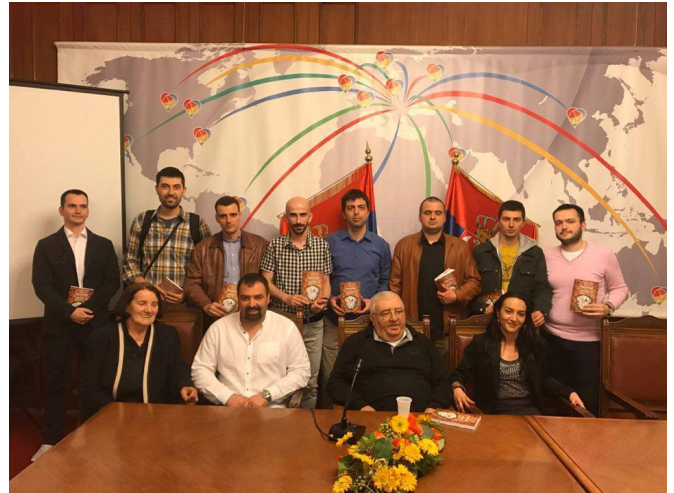
Промоција нове књиге Аврамова земља у Београду, 31. Марта 2017.

времена, а пријатељи да чују како родослови настају, и како се живело у старом Параћину у 18. и 19. веку.