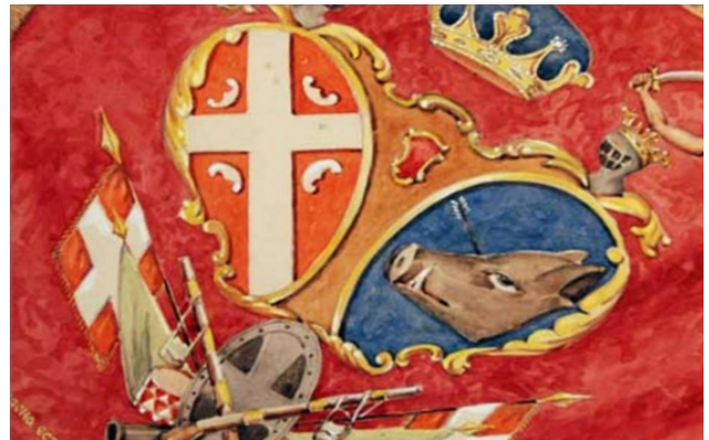
Први србски устанак

С почетка 19. века у Трешњевици и Јагодинској нахији био је познат човек и богат домаћин Кара Стеван, кога је красила и велика храброст. На историјску сцену излази почетком 1804. године са дизањем Првог србског устанка.