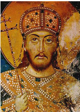
Цар Душан - Фреска из манастирске цркве у Леснову, око 1350. године и