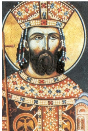
Кнез Лазар - део фреске у капели манастира Ресаве - Манасија