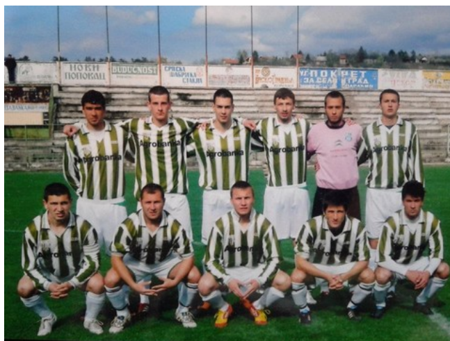
Први тим ФК Јединство Параћин