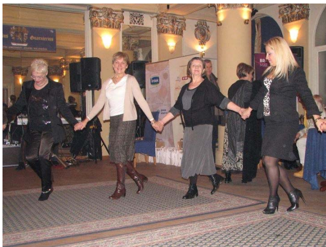
Играло се и певало и било је весело