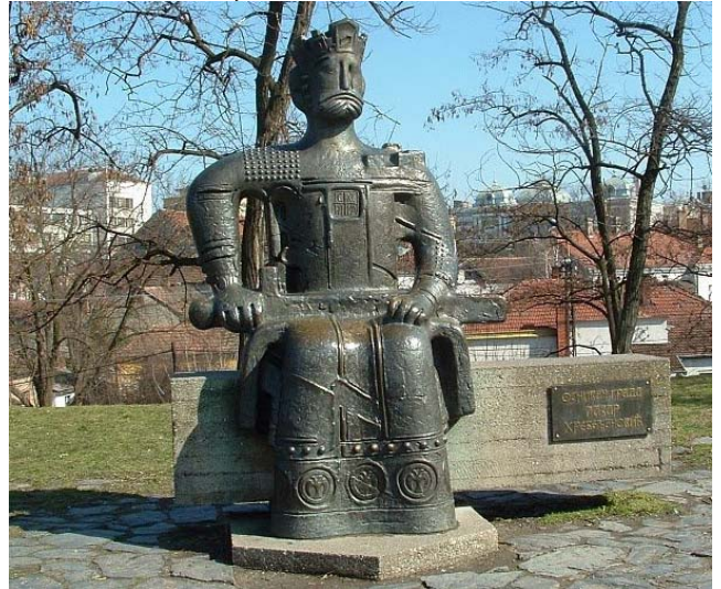
Споменик Кнезу Лазару у Крушевцу