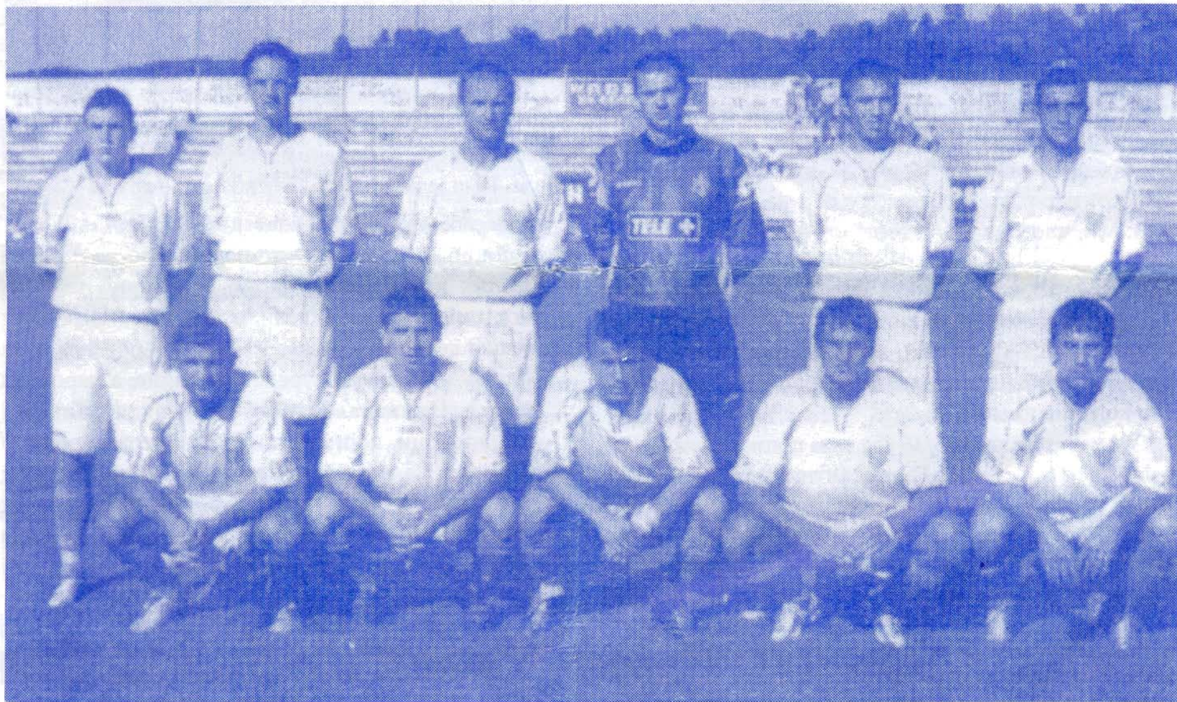
Фудбалски тим „Јединство“ данас