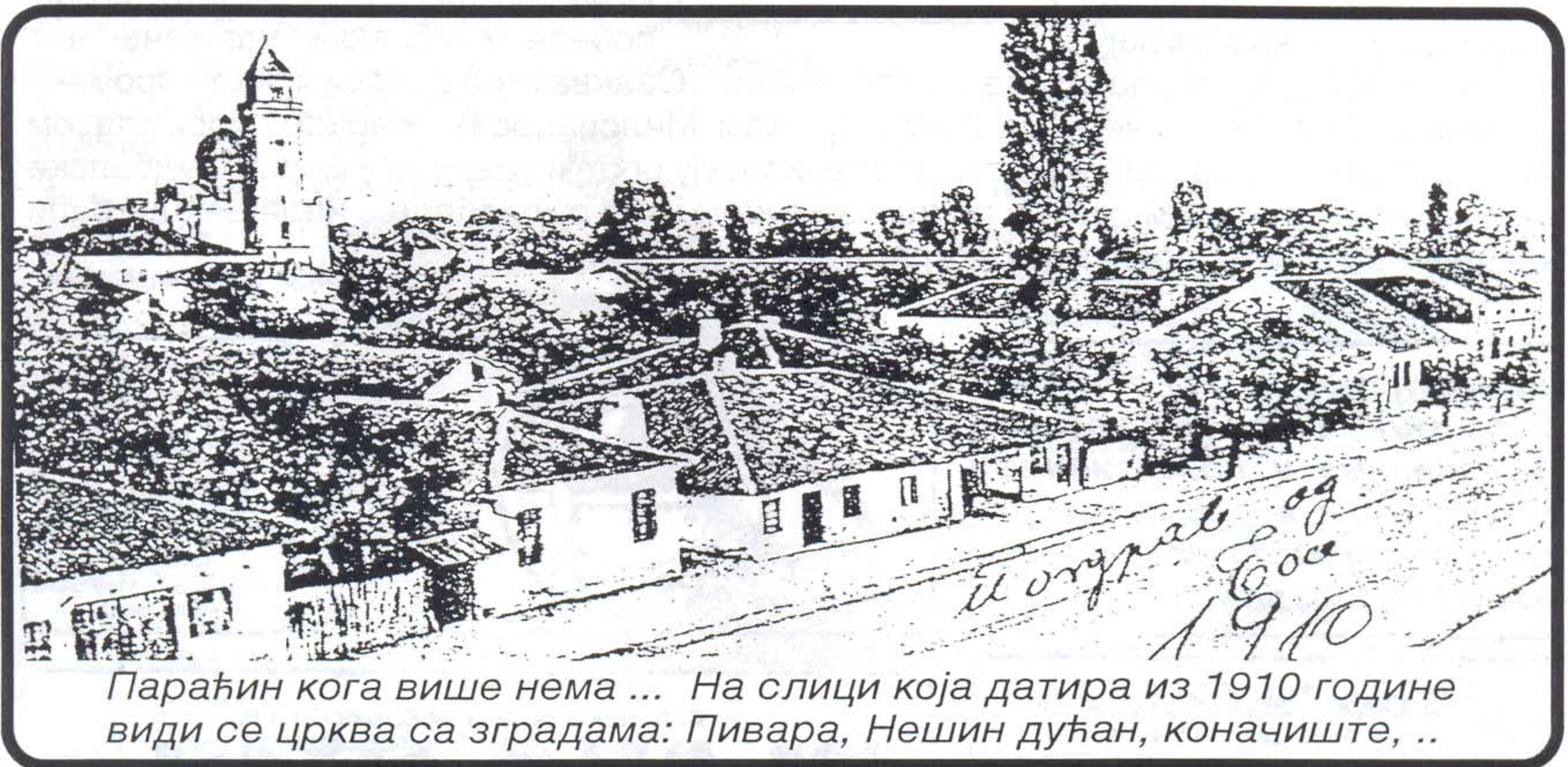
Параћин кога више нема ... На слици која датира из 1910 године види се црква са зградама: Пивара, Нешин дућан, коначиште, ..