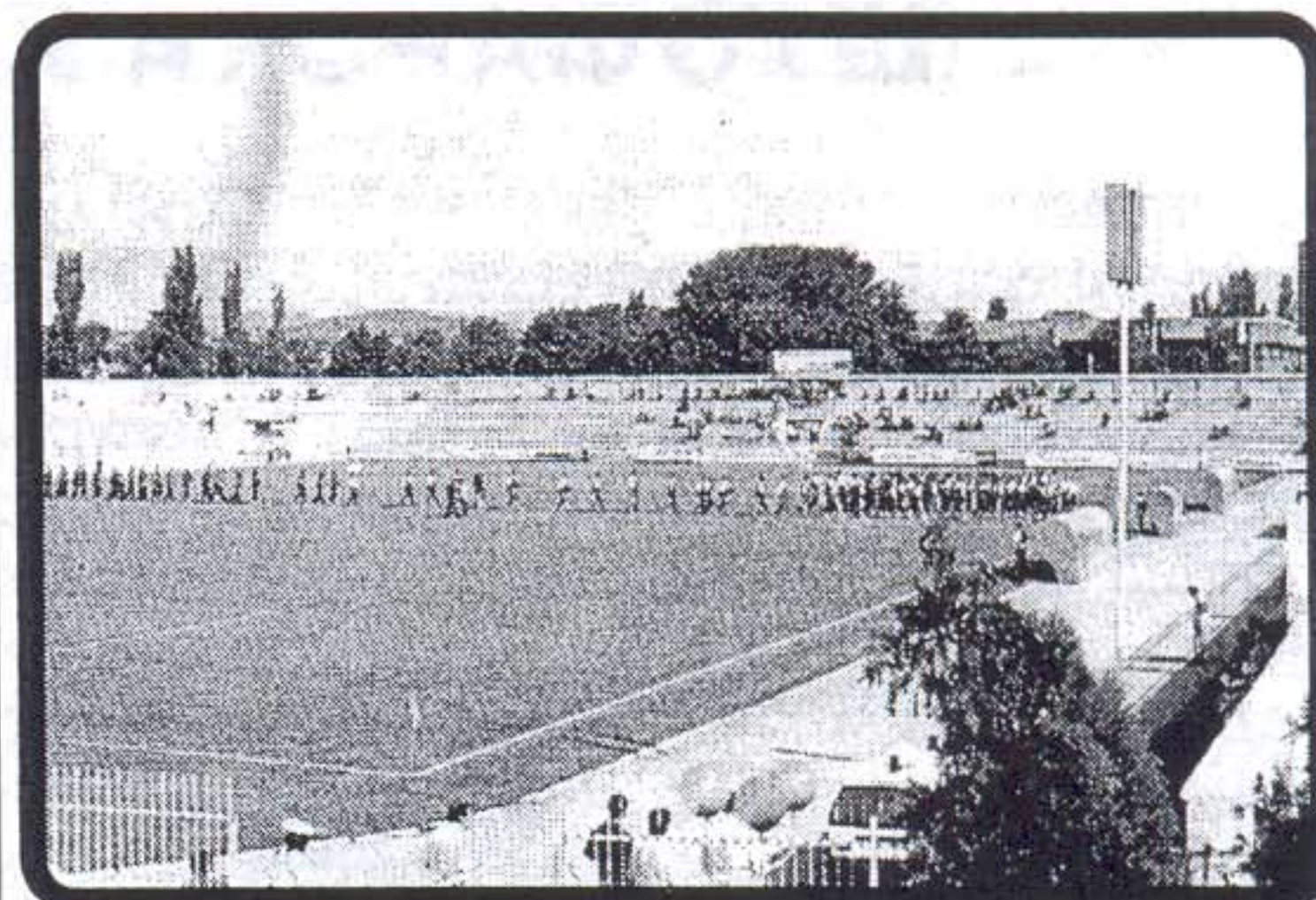
Изглед стадиона после реновирања